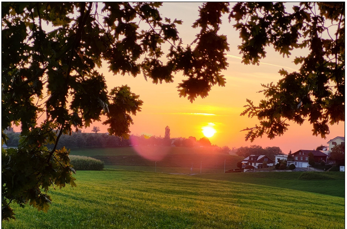
Sonnenuntergang mit Blick auf die Agenstrasse