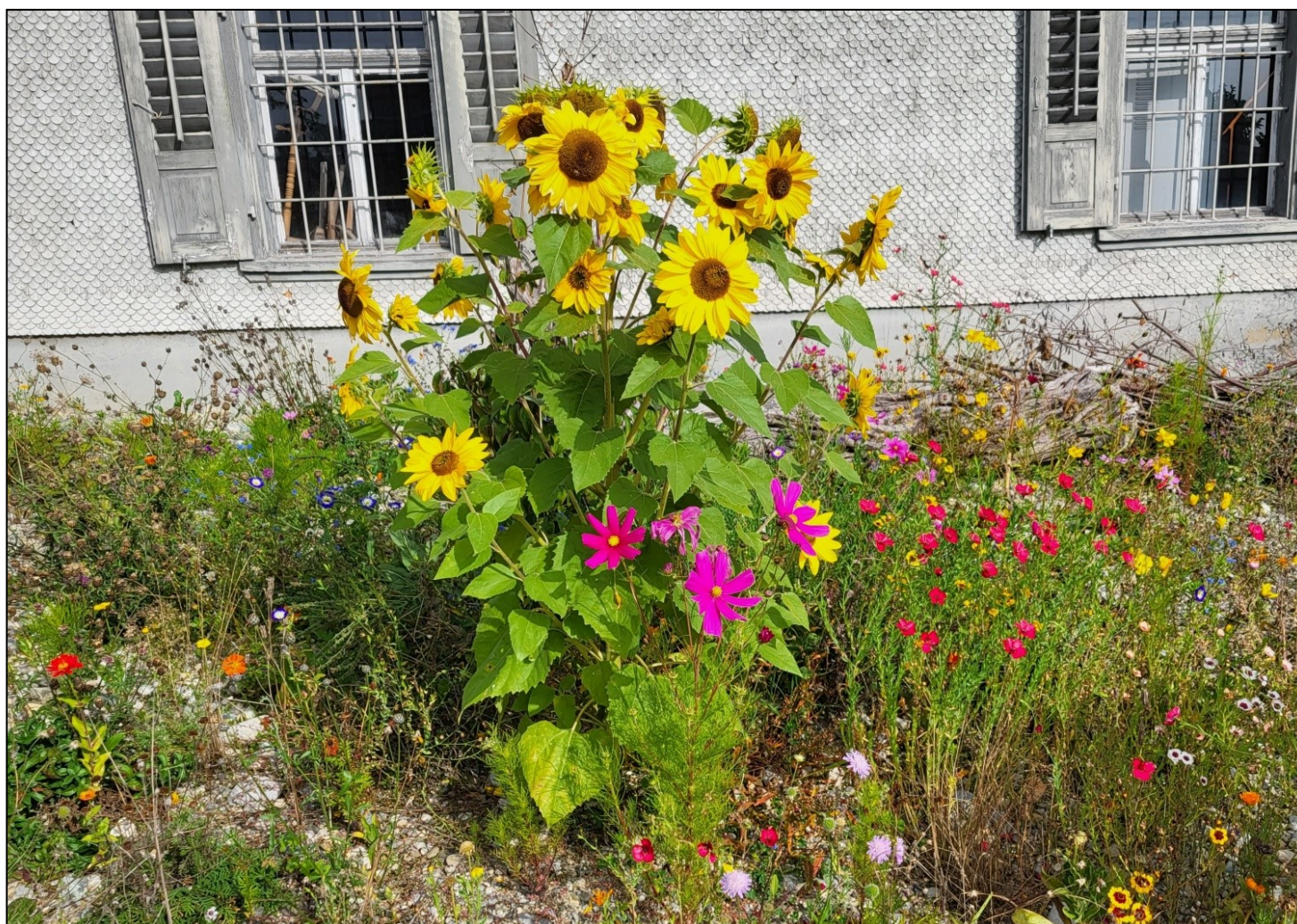
Blühende Biodiversität beim Spritzenhaus