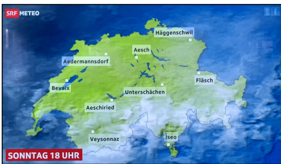
«unser Dorf» im SRF Meteo vom 16. September 2023

Alle Angaben und weitere Informationen finden Sie unter: www.evangel-roggwil.ch